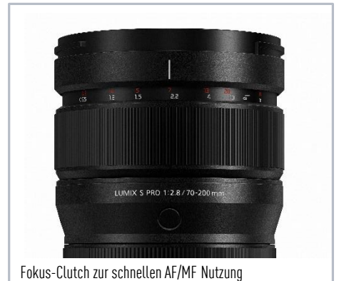
Fokus-Clutch zur schnellen AF/MF Nutzung