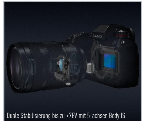
Duale Stabilisierung bis zu +7EV mit 5-achsen Body IS