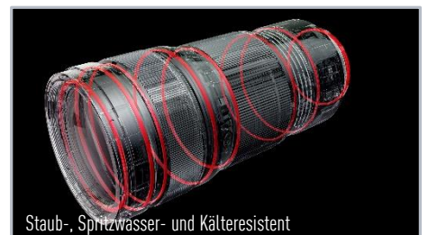
Staub-, Spritzwasser- und Kälteresistent

S-E70200E | EAN 5025232910793 | UVP: 2.799,00€