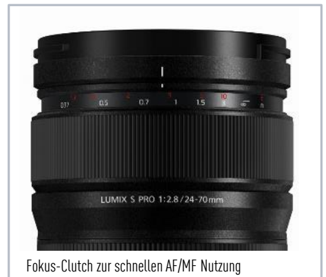
Fokus-Clutch zur schnellen AF/MF Nutzung