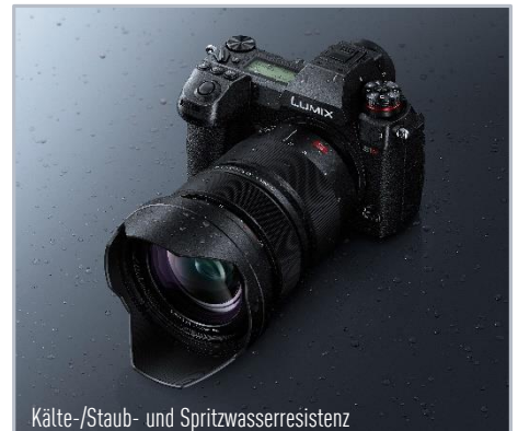
Kälte-/Staub- und Spritzwasserresistenz